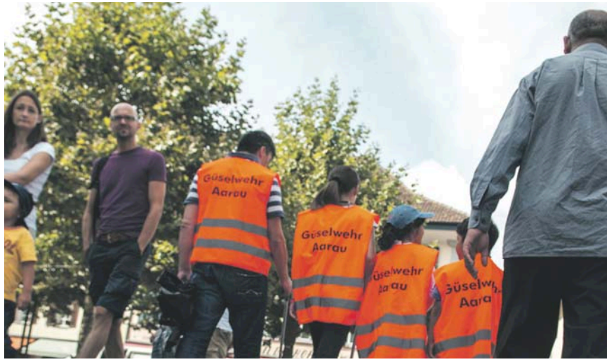
Am Samstag, 21. März wird die Bevölkerung zum gemeinsamen Frühlingsputz mit der Aarauer Güselwehr eingeladen

Der Samstag, 21. März 2015, wird in Aarau zum besonderen Frühlingsanfang. Neben der bereits laufenden «Hasenausstellung» stehen weitere Aktionen auf dem Programm.